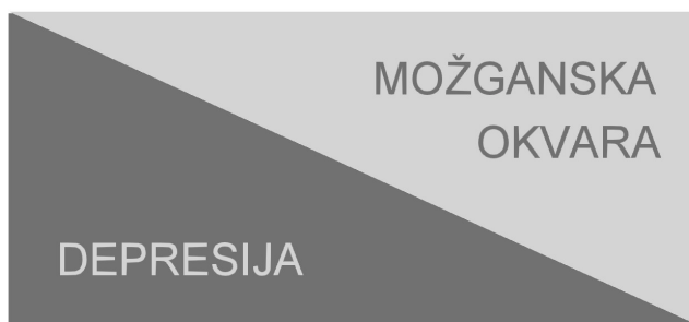
Slika 2: Vzrok spoznavnih motenj.

Motnje spoznavnih sposobnosti, ki spremljajo depresijo, so lahko posledica same depresije, lahko pa so posledica spremljajoče možganske okvare. Večina bolnikov je verjetno v širokem razponu med obema skrajnostima (18).